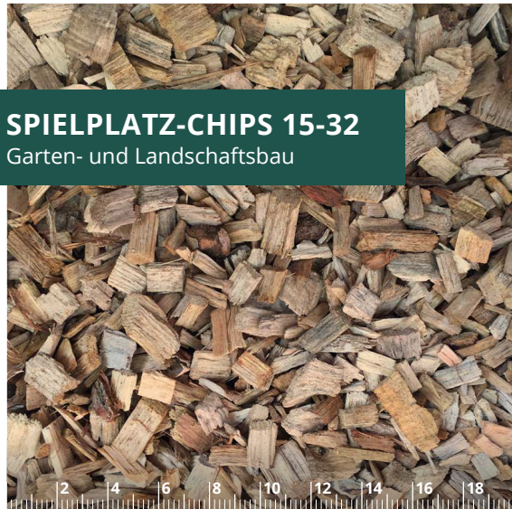
SPIELPLATZ-CHIPS 15-32 Garten- und Landschaftsbau